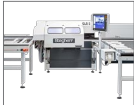
Tronçonneuse à CN type GLS-2 avec réglage des angles de coupe en deux plans