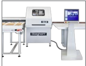
Tronçonneuse à CN type GLS pour la coupe d'angles de jusqu'à +/-81°