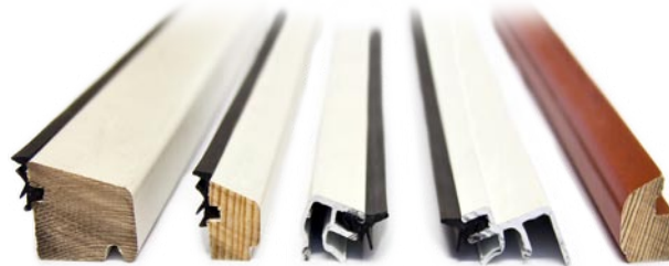
GLS en exécution spéciale pour angles de coupe de jusqu'à +/-81°

La GLS en exécution spéciale peut réaliser des coupes de jusqu'à +/- 81°.